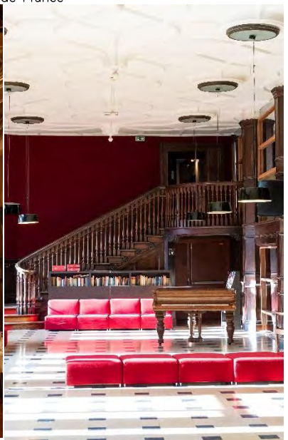
@Antoine Meyssonnier | Collège franco-britannique

Découvrir les expériences et tous les espaces : www.ciup.fr/la-fabrique-dexperiences