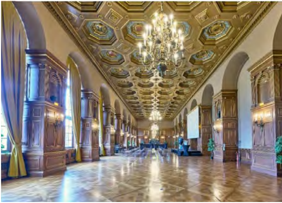
@Antoine Meyssonnier | Salon Honnorat