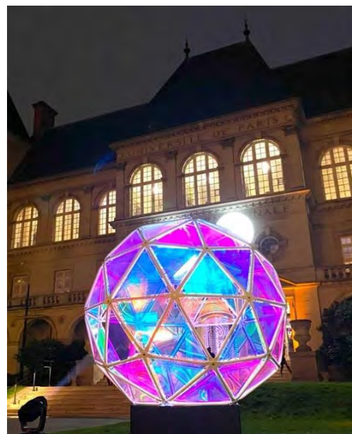
@Artpoint | « Lune Dichroïque » de Jérémie Bellot