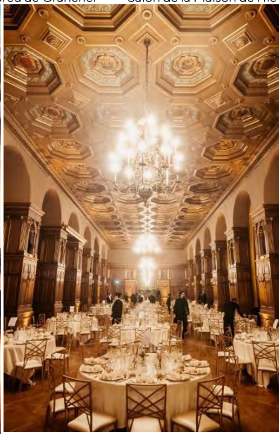
@Cédric Duquesnoy | Salon Honnorat