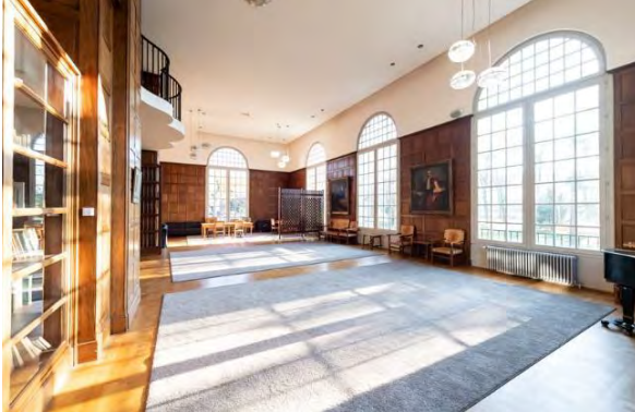
@Antoine Meyssonnier | Salon de la Fondation Abreu de Grancher