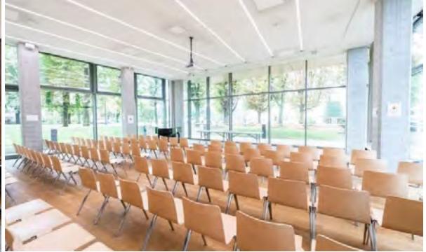
Salon de la Maison de l'Île-de-France