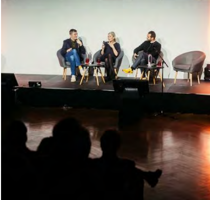
@Cédric Duquesnoy | Espace Adenauer