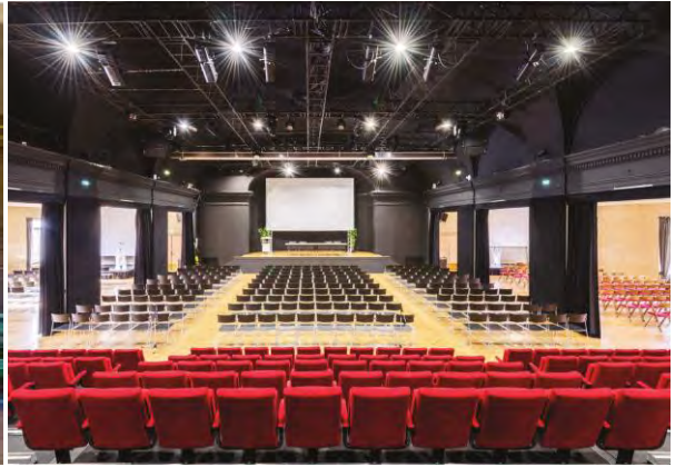
@Jelena Stajic | Espace Adenauer