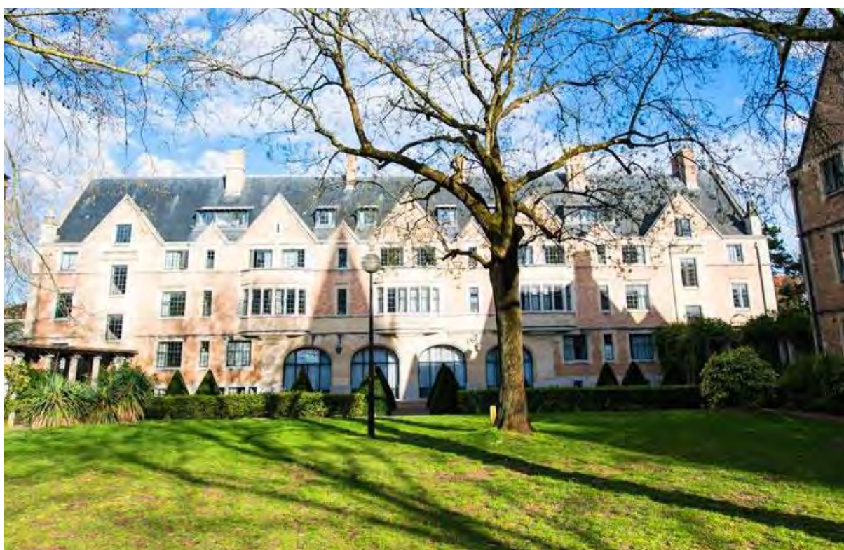
Jardin de la Fondation Deutsch de la Meurthe

Les entreprises et institutions pourront inventer des événements sur mesure qui leur ressemblent. La Cité internationale constitue une source d'inspiration fructueuse et ouvre la voie à des expériences entièrement personnalisées que les équipes de la Fabrique d'expériences réaliseront avec agilité et audace.