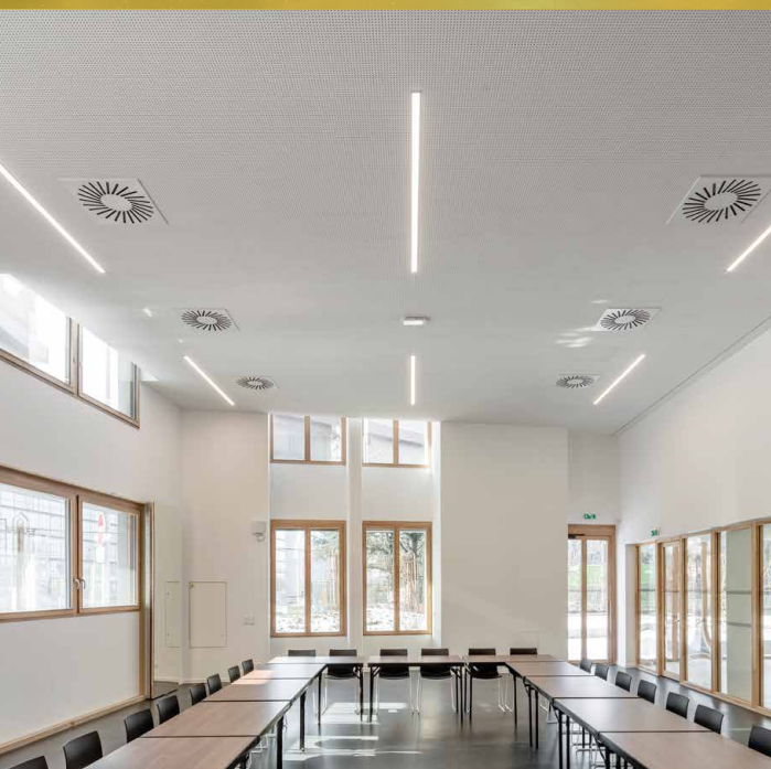
Lumière du jour occultable