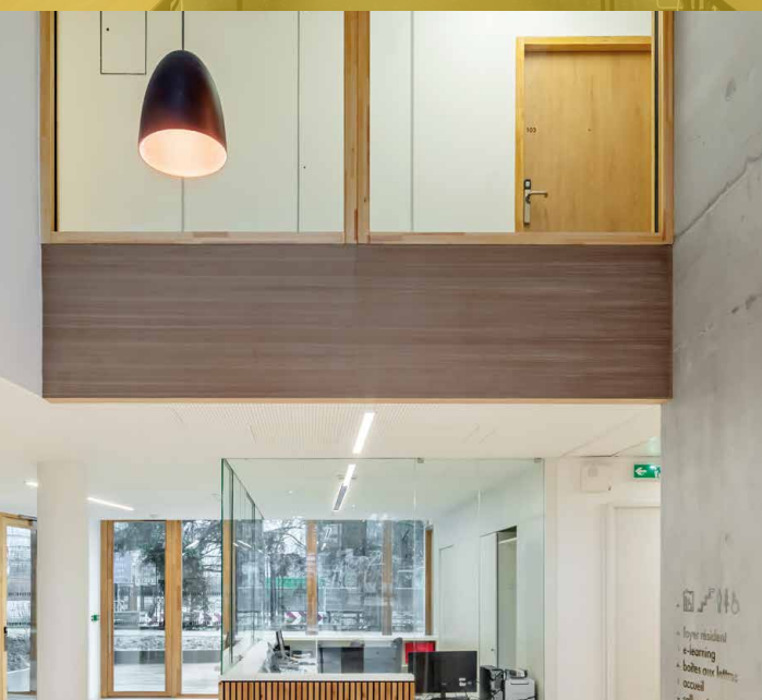
Accueil non privatisable

Une silhouette s'élève en « proue » à l'extrémité sud-ouest du campus. La Maison des étudiants de la francophonie accueille des étudiants et des chercheurs issus du monde francophone . La construction répond à des critères de performance énergétique stricts pour limiter son impact environnemental. La salle Léopold Sédar Senghor se situe au rez-de-chaussée de la maison. Aux couleurs béton et sable, une paroi vitrée occultante ouvre celle-ci sur le hall d'accueil de la maison. Un mur escamotable offre la possibilité de bénéficier de la lumière du jour ou d'un grand miroir .