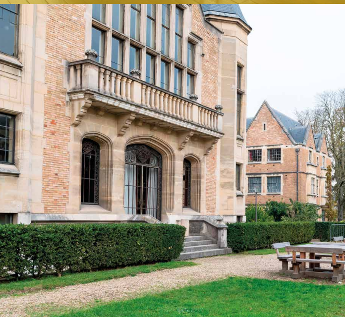
Terrasse privée accessible depuis le grand salon

Issu d'une grande famille de mécènes, Emile Deutsch de la Meurthe a financé la construction des sept pavillons disposés autour d'un jardin central . Inaugurée en 1925, la Fondation Deutsch de la Meurthe est la première maison de la Cité internationale . Son style architectural évoque celui des collèges anglais.