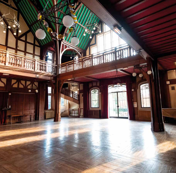
Grand salon : modulable, accès direct à la terrasse et à la mezzanine