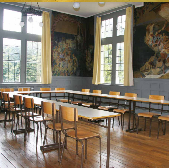
Salle des fresques : située au premier étage avec un accès direct mezzanine