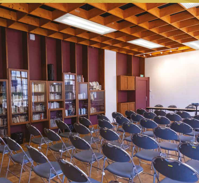
Séminaires et ateliers en petit comité