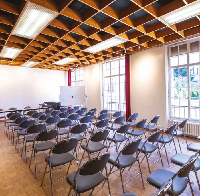
Un salon à la lumière du jour