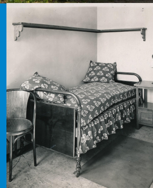
CHAMBRE D'ORIGINE