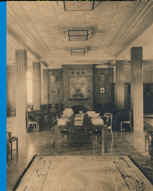
GRAND SALON