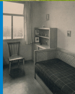
CHAMBRE D'ORIGINE